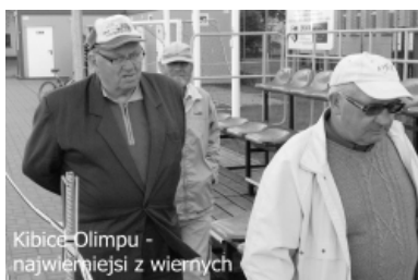
Kibice Olimpu - najwielniejsi z wiernych

Po kilkudziesięciu latach oczekiwań piłkarze MKS Olimp Złocieniec awansowali do wysokiej już klasy rozgrywek, do Ligi Makroregionalnej. W niedzielę, 23 bm., (1992r) powitamy ich na miejskim stadionie w