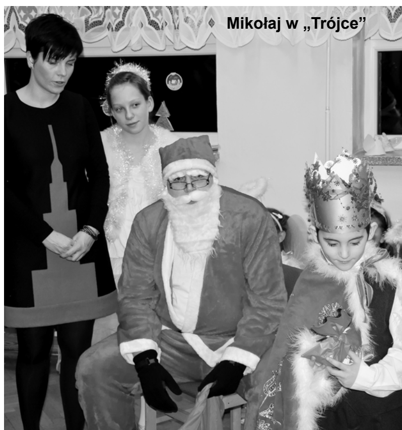
Mikołaj w „Trójce”

Zdjęcie do Galerii Wieści można wykonać w Foto-Video „Krzyś” w Świdwinie, www.fotopyrczak.pl