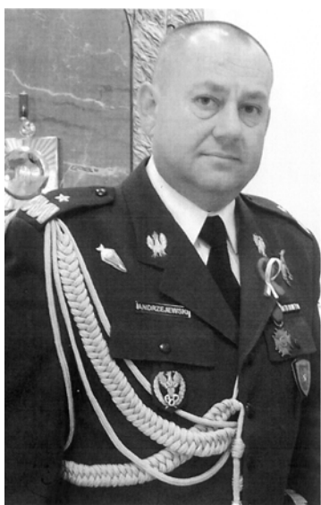
Gen. bryg. pil. Andrzej Andrzejewski