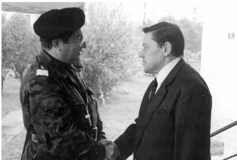
Gen. dyw. ks. bp połowy RP Sławoj Głódź