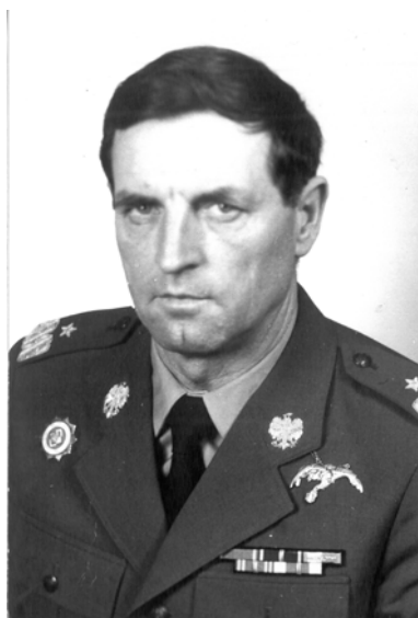
Gen. dyw. pil. Kazimierz Dziok