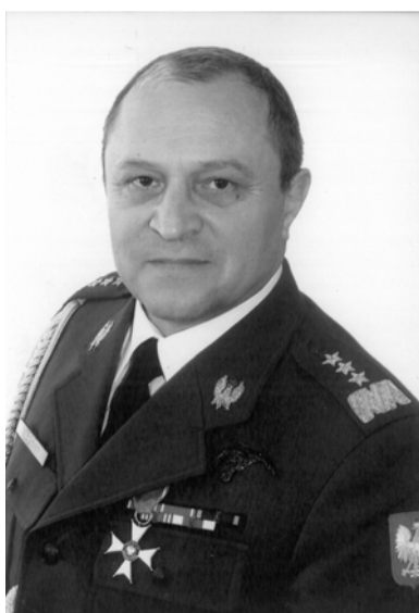
Gen. broni pil. Stanisław Targosz