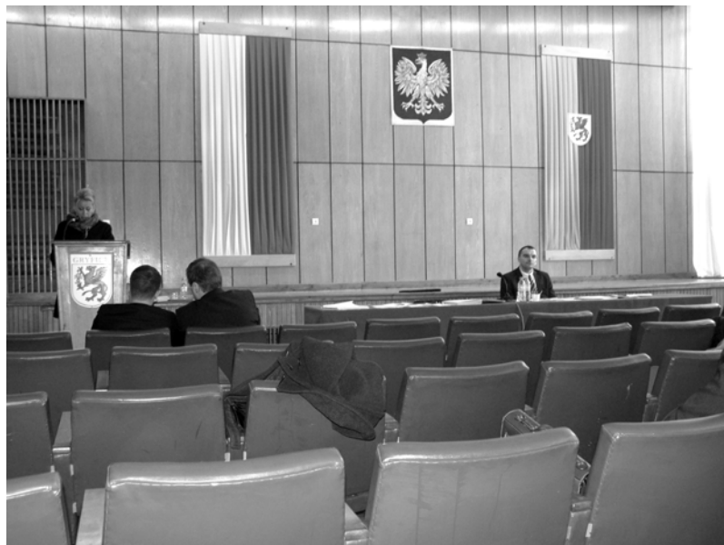
Przew. Komisji Rewizyjnej czyta przy „wypełnionej” sali obrad swój elaborat na temat służbowego samochodu burmistrza Gryfic

Podjęto dwie uchwały w sprawie wyrażenia zgody na sprzedaż lokalu