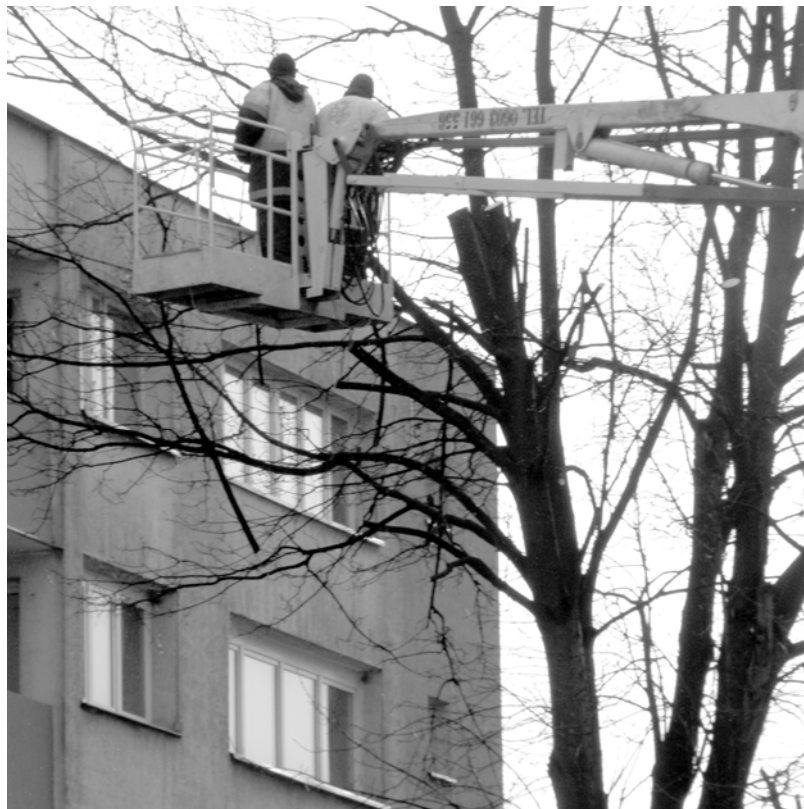
Przycinka konarów drzewa przy ul. Nadrzecnej.

Kiedy w Gryficach zaczynają przycinkę konarów drzew, to nieomylny znak zbliżającej się wiosny. Mamy nadzieję, że w tym roku miesz-