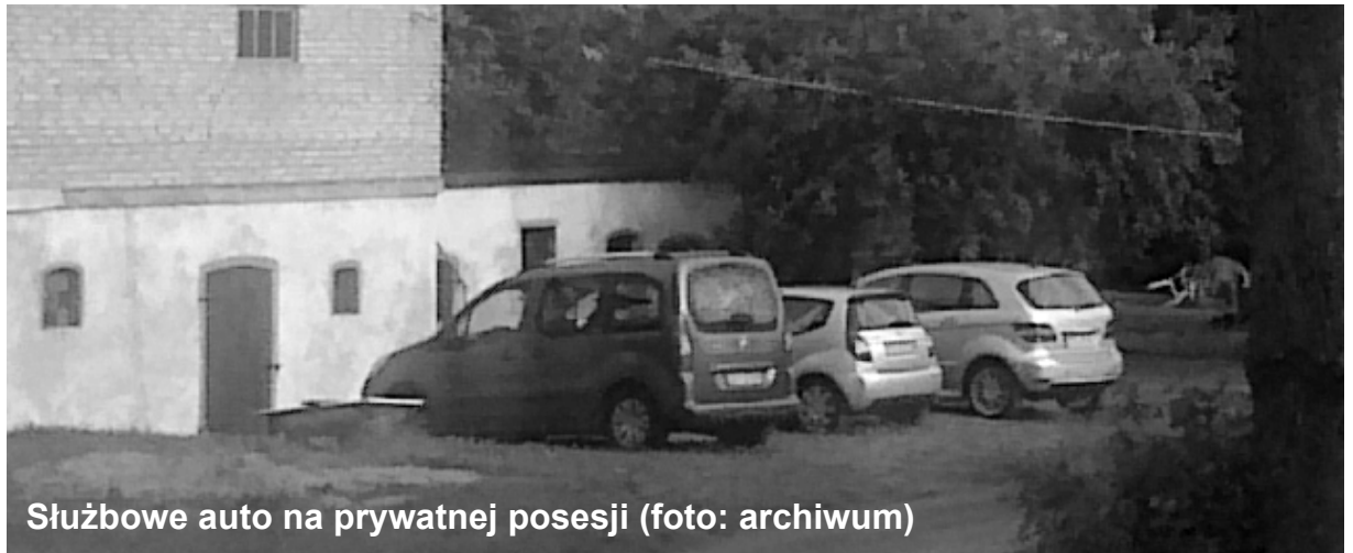
Służbowe auto na prywatnej posesji

Jednak później nad tą sprawą zapadła cisza.