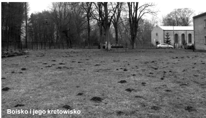
Boisko i jego kretowisko

Radny Stołowski rzucił hasło, przew. Komisji Budżetu i Finansów usłyszał i w budżecie gminy na rok 2013 zaklepał. Ale mają jeszcze szansę na zmiany tj. modernizację istniejącego boiska: wyrównanie całej powierzchni, założenie siatek przeciw ryjącym kretom, wymalowanie całego ogrodzenia szkoły, wymianę dachu nad szkołą i halą sportową. A sztuczną nawierzchnię niech sobie położy w innym miejscu. MJ