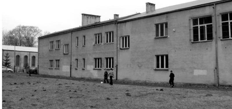
SP Prusinowo i hala sportowa od strony wschodniej

widzów są, ale nawierzchnię boiska można wyrównać, założyć siatkę przeciw kretom. Od zawsze jest tak, że z nadejściem wiosny, aż po późną jesień, sami muszą zadbać o codzienne niwelowanie kretowisk. Same ławki na trybunach można byłoby przebudować, bo też wszelkie naprawy wykonują we własnym zakresie, dzięki życzliwości ludzi np. leśniczego. W samej szkole przydałaby się wymiana dachu nad halą sportową. Jest z blachy, ale miejscami przecieka, w końcu ma już około 20 lat i to bez remontu. Przydałoby się zmienić całą elewację szkoły itd. Boisko, które jest, spełnia swoją rolę. Dzieci mają miejsce na bieganie i różne gry, poza tym na tym boisku organizowane są festyny dla dzieci, nie tylko z okazji Dnia Dziecka.