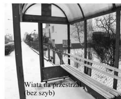
Wiata na przystanku (bez szyb)

Biurowi turystyczne odkleiło ze sklepu PSS Jutrzenka przy Rondzie księdza Jana reklamę umieszczoną na stylowej ścianie, ale resztki pozo-