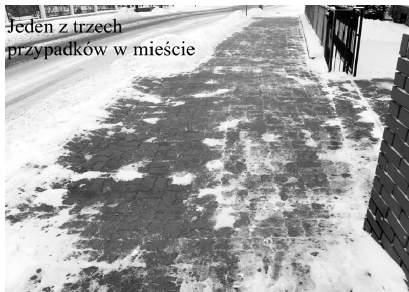
Jeden z trzech przypadków w mieście