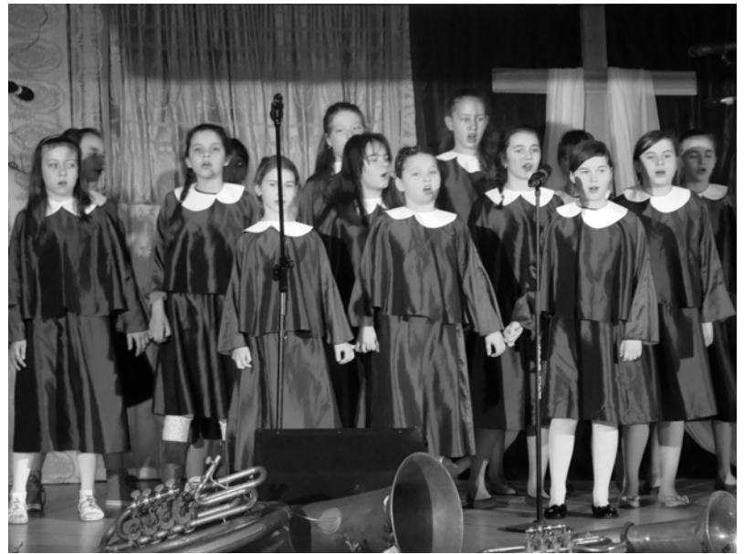
U góry zespół AGNUSKI, na dole: GENEZARET.

Uczniom i ich opiekunom, życzymy wiele dobrego i dalszych sukcesów. (JG)