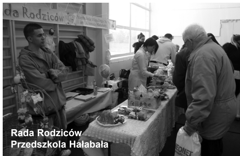
Rada Rodziców Przedszkola Hałabała