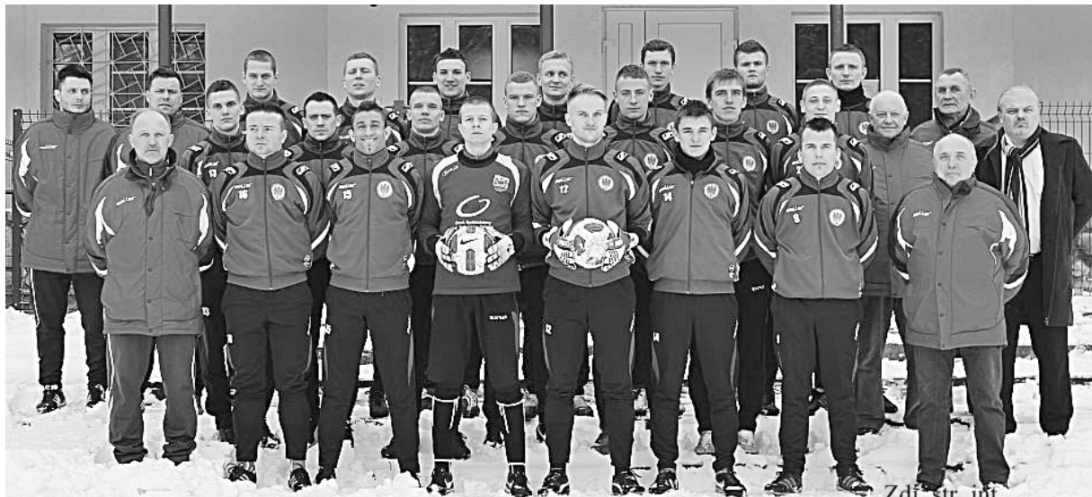
Drawa Drawsko Pomorskie III LB