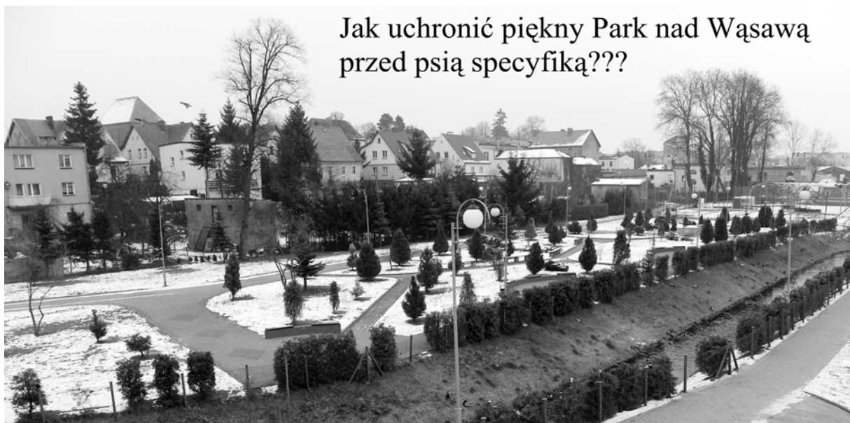
Jak uchronić piękny Park nad Wąsawą przed psią specyfiką???

W niedzielny ranek obchodzę sobie kilka parkingów w mieście. Zajęte do ostatniej dziurki. Bardzo dużo samochodów marek światowych, jak spod igły. Tyle, że miejsca na nich brak w jeszcze dziewiętnastowiecznej zabudowie miasta. Tu, na tym Starym Rynku, dawno temu widziałem pierwszego Fiata 125 P produkowanego w Polsce. Na olbrzymim placu przed ratuszem nie było żadnego innego samochodu. W owych latach samochód, a do tego prywatny, to nie była codzien-