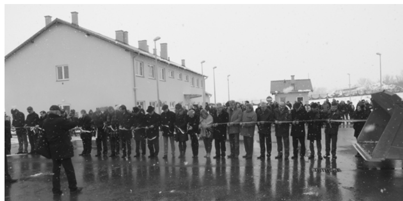
Wstęga na otwarcie RZGO przecinają wójtowie i burmistrzowie gmin CZG R-XXI i zaproszeni goście. W tle okazały biurowiec.