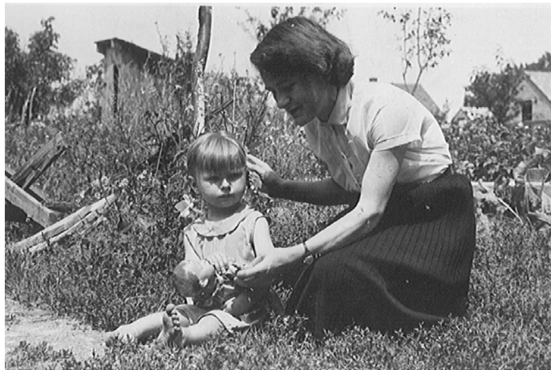
Mama i ja - myślę że 1962-3 rok