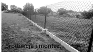
produkcja i montaż.

pod siatkę, panele ogrodzeniowe i pergole ogrodowe od 18 zł/mb netto