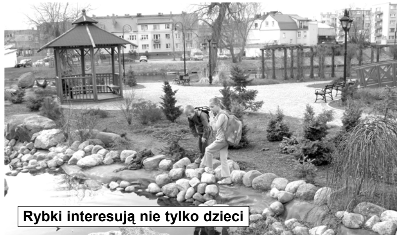
Rybki interesują nie tylko dzieci

Łamane są drzewka, zdarza się również, że wykopywane po to, by przesadzić je do prywatnych ogo-