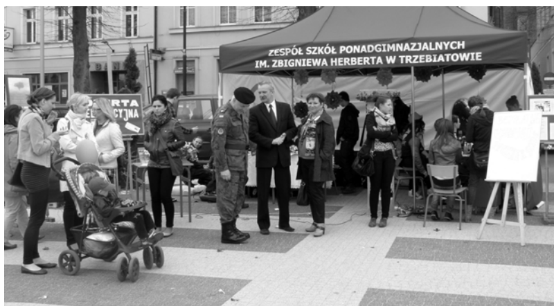
ZSP im. Zbigniewa Herberta w Trzebiatowie

Starostwo Powiatowe w Gryficach 29 kwietnia br. na placu Zwycięstwa w Gryficach po raz piąty zorganizowało Targi Edukacyjne dla ... niewiadomo kogo!