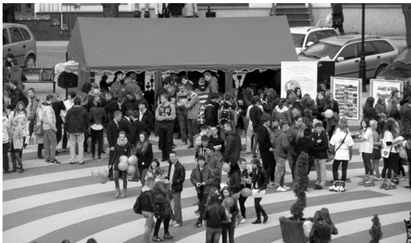
ZSP im. Czesława Miłosza w Gryficach