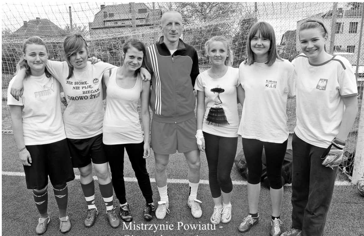
Mistrzyni Powiatu -

godnie wyjeżdżamy na gry w półfinalach. Nie jest wykluczone, że dalsze gry o mistrzostwo gimnazjów odbędą się u nas w Złocińcu. -