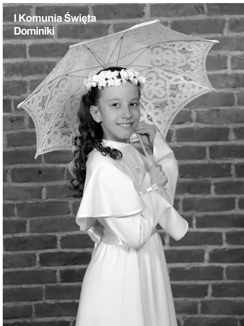
I Komunia Święta Dominiki

Zdjęcie do Galerii tygodnika można wykonać w Foto-Video „Krzyś” w Łobzie, www.fotopyrczak.pl