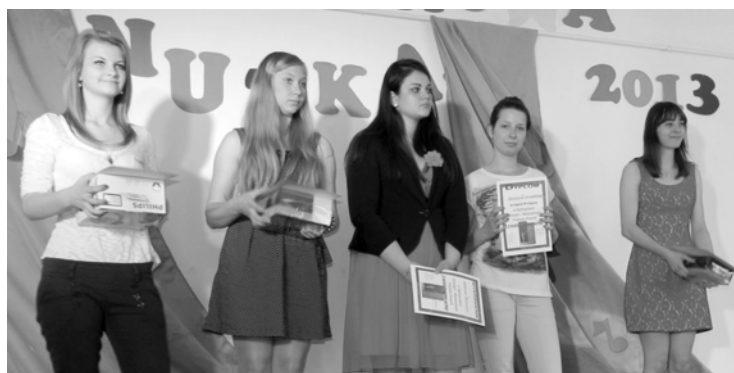
Laureatki kat. ponadgimnazjalnej placówki