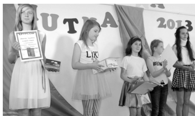
Laureatki kat. IV- VI szkoły soliści