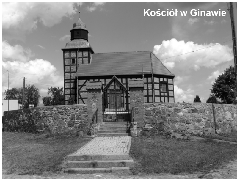
Kościół w Ginawie

W naszym kraju geocaching jest jeszcze słabo rozwinięty, odstajemy i to bardzo od naszych zachodnich, północnych i południowych sąsiadów. Im dalej na wschód Europy, tym gorzej. Rozwój geocachingu w Polsce obserwuję od początku 2011 roku. Wówczas mieliśmy nieco ponad tysiąc zarejestrowanych skrytek. Ale w ostatnim czasie coś drgnęło, znalazły się miejscowości z województwa kujawsko-pomorskiego, które potraktowały tę zabawę po-