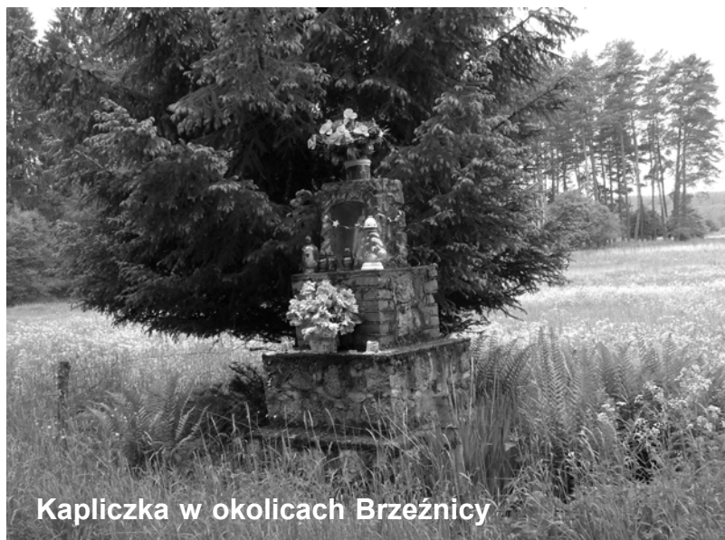
Kapliczka w okolicach Brzeźnicy