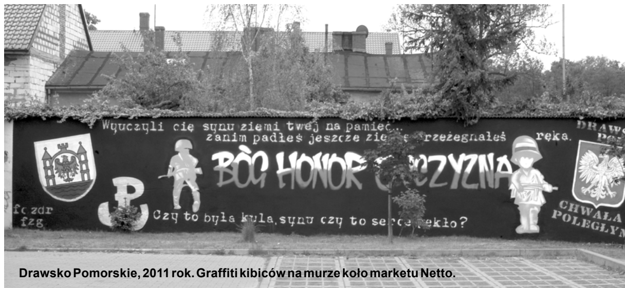
Drawsko Pomorskie, 2011 rok. Graffiti kibiców na murze koło marketu Netto.