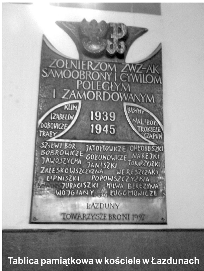
Tablica pamiątkowa w kościele w Łazdunach