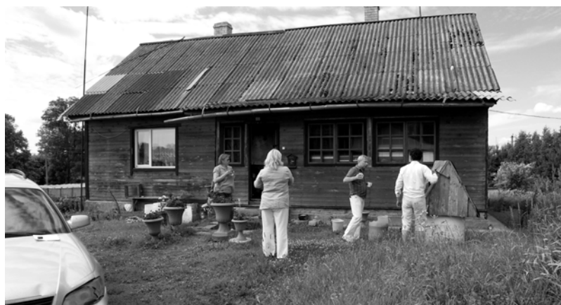
U góry: na plebani u proboszcza w Kiemieliskach. Na dole: cmentarz w Kiemieliskach.