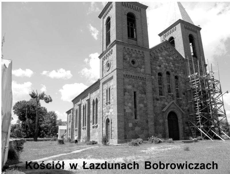
Kościół w Łazdunach Bobrowiczach

wszystkie kościoły w okresie panowania tu Związku Sowieckiego zostały zamienione na magazyny, sale kinowe, a nawet muzea ateizmu. Obecnie część dawnych polskich kościołów została przywrócona liturgii i trwa ich odbudowa. Jednak o ile łatwiej jest odbudować ściany, trudniej odbudować wspólnotę. Cała wieś nadal pracuje w kolchozie, które na Białorusi zachowały się w stanie prawie że nie naruszonym. Niestety, tworzyły one i tworzą specyficzną kulturę kolchozową. Proboszcz do jednych z największych problemów zalicza pijaństwo. Próbuje coś z tym zrobić, ale praca wydaje się ponad jego siły. Sam robi wszystko; naprawia, kosi, uprawia ogród, gotuje, zajmuje się kościołem i parafianami. I znikąd pomocy, bo wkoło, na ogromnych przestrzeniach, jest podobnie. To codzienność kościoła katolickiego w tym kraju. Książ parafialnych nie ma. Władze zabrały i wywiozły. Dokąd nie wiadomo. Oprawdza nas po świątyni. Tu jakby zastygły wieki. Żegnamy się z nadzieją na ponowne odwiedziny i może jakąś pomoc w przyszłości.