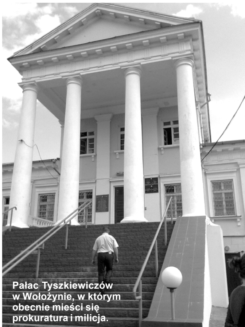
Pałac Tyszkiewiczów w Wołożynie, w którym obecnie mieści się prokuratura i milicja.