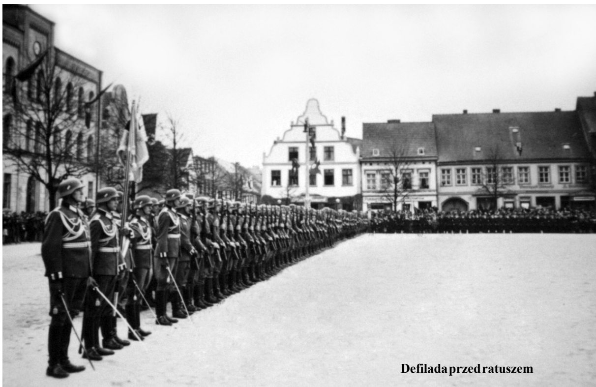
Defilada przed ratuszem

osób, a powiatu - 47.806 osób. Od 1932 roku partia narodowosocjalistyczna (NSDAP) miała coraz większe poparcie tutejszego społeczeństwa i całej Prowincji Pomorskiej. Potwierdzały to zresztą wyniki wyborcze przez nią uzyskiwane. Ideologia faszystowska znalazła podatny grunt na tej niemieckiej Prowincji. Szczególnie wieś wiązała wielkie nadzieje z programem hitlerowskim, który przewidywał tworzenie silnych i samodzielnych gospodarstw wiejskich i dawał nadzieję na pomoc państwową w przetrzymaniu długotrwałego kryzysu. O sympatii tej ludności dla narodowych socjalistów świadczyć mogą i inne fakty. Np. 19 lipca 1933 roku Adolf Hitler uznany został honorowym obywatelem Labez (ob. Łobza). Zdarzały się jednak również wystąpienia antyfaszystowskie, np. w Treptow (ob. Trzebiatów), co uznać należy za szczególnie wyraz odwagi osób protestujących, ponieważ kierownictwo powiatowe NSDAP mieściło się w Treptow, a nie w Gryfenberg. Kierownikiem był Franz Ohm. W jego cieniu pozostawał landrat powiatu Hans Heinrich von Holstein, który z kolei urzędował w Gryfenberg. Poparcie dla Adolfa Hitlera i jego poczynań było olbrzymie wśród mieszkańców dawnych Gryfic. Cdn.