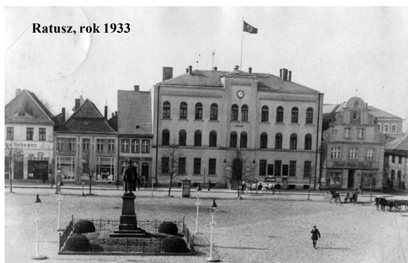
Ratusz, rok 1933

Opublikowany tekst w Gazecie ma jeszcze jeden plus, pobudza wyobraźnię. Właśnie ciekawe jak wyglądał 1 września 1939 r. tutaj? Nie znamy relacji świadków czy dawnych mieszkańców. Może warto jednak zastanowić się nad tym, jak daw-