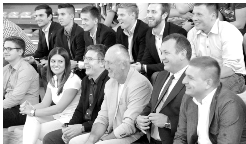
U góry: konwent Młodych Demokratów z udziałem polityków PO, który poparł inicjatywę referendum w Gryficach