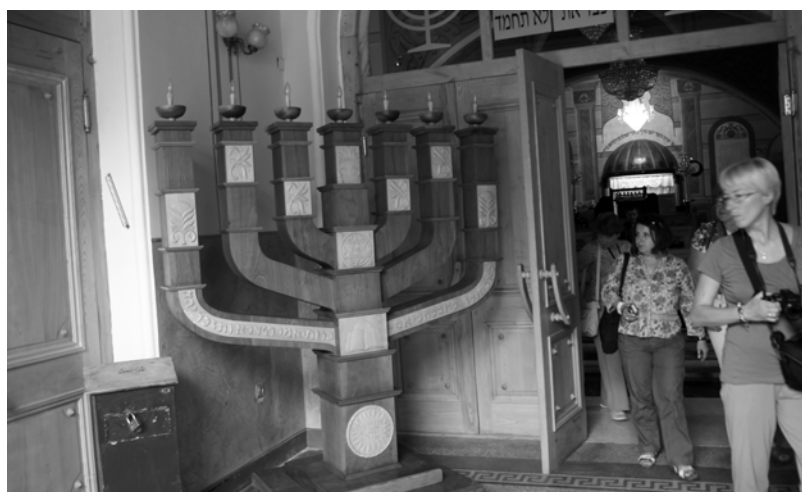
Menora w Synagodze