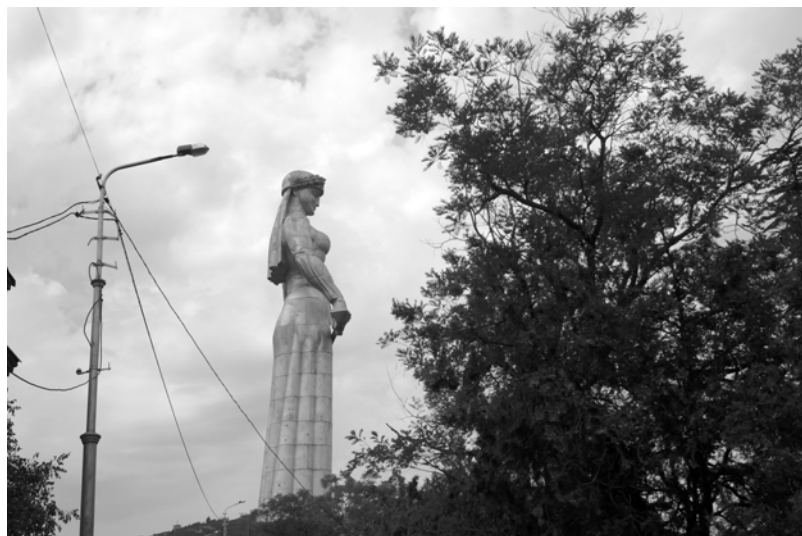
Pomnik Matki Gruzji

Cóż jeszcze w tej Gruzji? Najważniejsze to krajobrazy gór, dolin, czystych rzek, to radość i przeżycia spowodowane ich oglądaniem. To setki zdjęć i opowiadanie po powrocie. To smak wina, który jeszcze do dziś zachowałem. To po prostu Gruzja. Tam trzeba być, to trzeba przeżyć. Niezapomniany nocleg na wysokości ponad 2200 m npm. Albo przejazd „Wojenno Gruzjińską Drogą” przez Przełęcz Krzyżową na wysokości około 2400 m npm., wspinać się pojazdem po krawędziach przepaści i nasycać się przepięknymi widokami wzdłuż tej drogi. Ale to szlak dla najbardziej odważnych, jeszcze teraz dech mi zapiera. Czterdzieści lat temu, kiedy jechałem tą drogą swoim wartburgiem, to byłem sam i kilka patroli milicji. Dziś ta droga jest w budowie, a jadą po niej karawany tirów z różnych krajów i nie potrzebna jest policja. Nikt tu nie pilnuje socjalizmu, bo nie ma tu takiego. Cdn. ZB