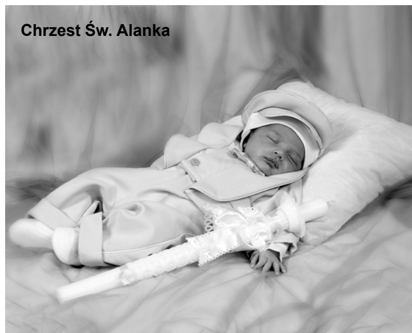
Chrzest Św. Alanka

Zdjęcie do Galerii tygodnika można wykonać w Foto-Video „Krzyś” w Łobzie, www.fotopyrczak.pl