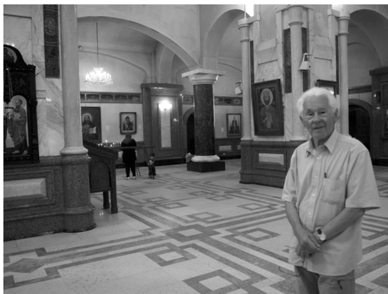
Wewnątrz największej cerkwi w Gruzji pw. Świętej Trójcy