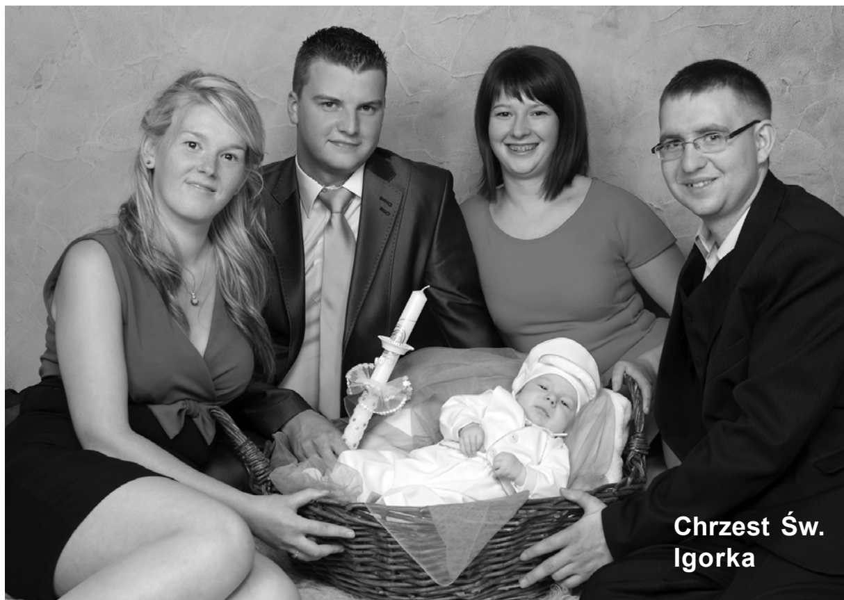
Chrzest Św. Igorka

Zdjęcie do Galerii tygodnika można wykonać w Foto-Video „Krzyś” w Łobzie, www.fotopyrczak.pl