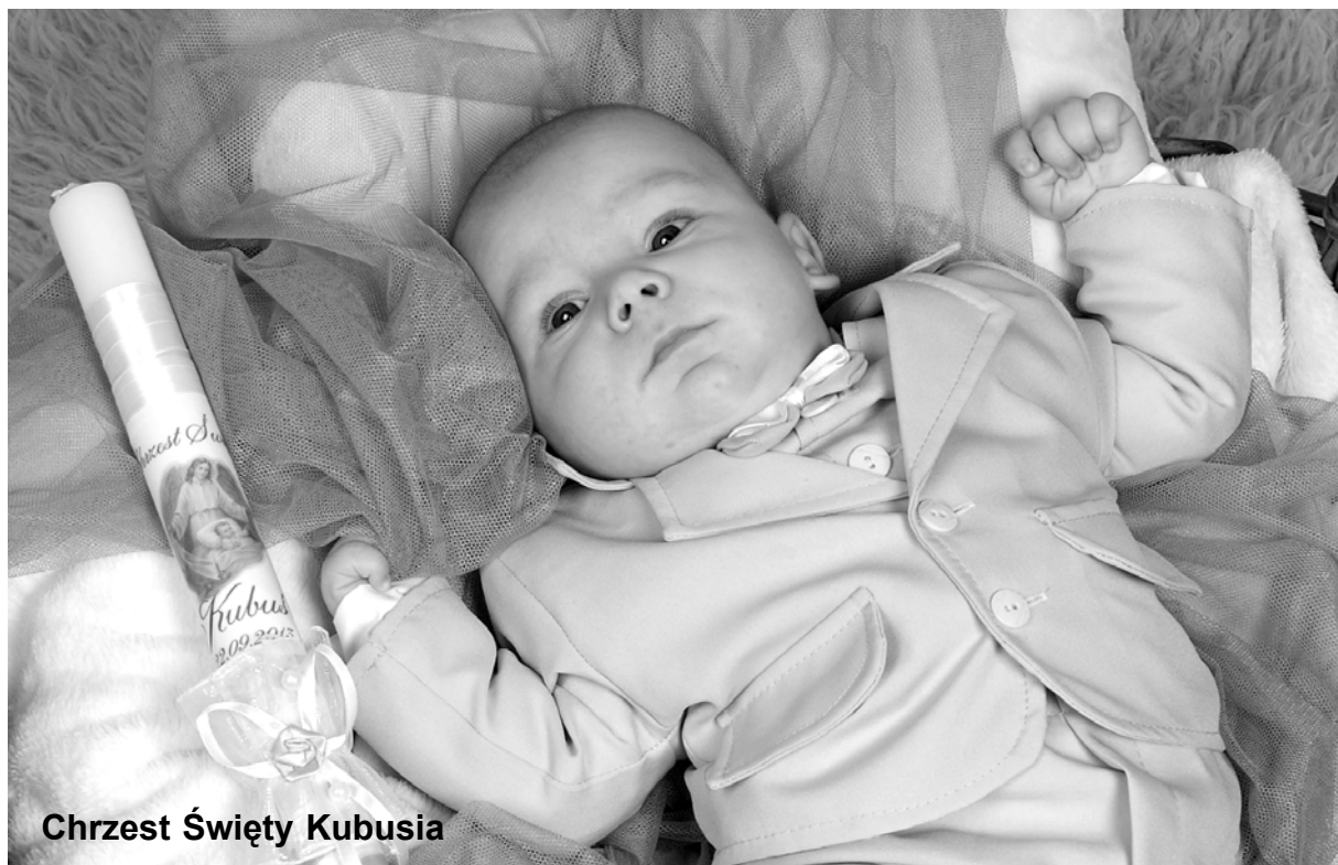
Chrzest Święty Kubusia

Zdjęcie do Galerii tygodnika można wykonać w Foto-Video „Krzyś” w Łobzie, www.fotopyrczak.pl