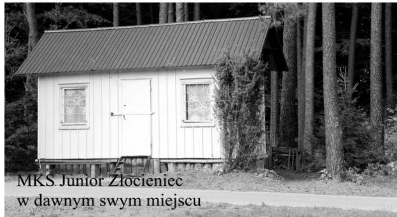
MKS Junior Złocieniec w dawnym swym miejscu

posiada pozytywną opinię Polskiego Związku Lekkiej Atletyki. Jest wykonana z wykładziny prefabrykowanej o grubości 13 mm. Materiał nie przepuszcza wody. Jest przystosowany do eksploatacji w butach z kolcami. To dotyczy też rozbiegów w konkurencjach technicznych. Wykładzina ma aktualny certyfikat IAAF. (4) Skocznia do skoku wżwyz. Zlokalizowana na zakolu nawierzchni kauczukowej prefabrykowanej. Między bieżnią a boiskiem piłkarskim. Początek rozbiegu z zakola o kącie 180 stopni. Minimum rozbiegu 15 metrów. Wyposażenie tego miejsca: stojaki, kompletny zeskok. Jest na to certyfikat IAAF. (5) Skocznie: do skoku w dal i do trójskoku. Wykonano dwie jednostronne skocznie z oddzielnymi rozbiegami w obu tych skokach. Lokalizacja – zakole z kauczukową nawierzchnią prefabrykowaną. W celu uniezależnienia zawodów sportowych od warunków pogodowych (wiatr), obydwie skocznie są dwukierunkowe. Zgodnie z zaleceniami Polskiego Związku Lekkiej Atletyki. (6) Rzutnia do pchnięcia kulą. Zlokalizowano urządzenia na płycie drugiego zakola z nawierzchnią trawiastą. Długość sektora rzutów wynosi 20 m. Sektor