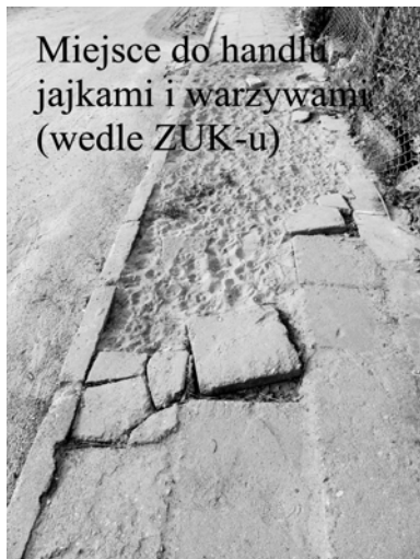
Miejsce do handlu jajkami i warzywami (wedle ZUK-u)