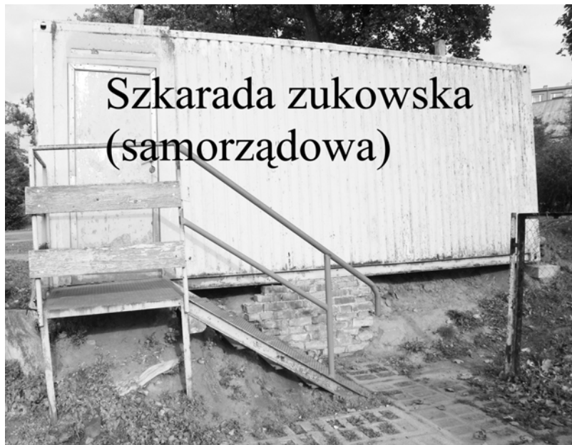
Szkarada zukowska (samorządowa)

(ZŁOCIENIEC). Trzy miesiące ludzie handlujący na targowisku proszą, by tak tu zadziałać, by była dodatkowa powierzchnia do pracy. A wystarczy tylko nieco odsunąć gruz po Ambasadzie i powierzchnia mogłaby być. Do handlu przede wszystkim owocami, warzywami i jajkami.