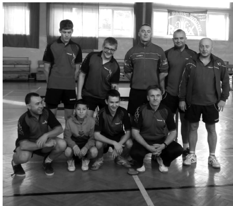
Drużyna MSZS Świdwin.

Serdecznie zapraszamy kibiców - wstęp wolny - hala OSIR, ul. 3 Marca w Świdwinie.