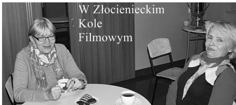
W Złocienieckim Kole Filmowym

(ZŁOCIENIEC). Podczas spotkania dyskutowaliśmy o filmach, które chcielibyśmy obejrzeć w ramach ZŁOCIENIECKIEGO KOŁA FILMOWEGO.