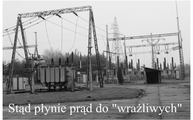
Stąd płynie prąd do "wrażliwych"

Ponieważ sprawy dodatków mieszkaniowych (postępowanie,