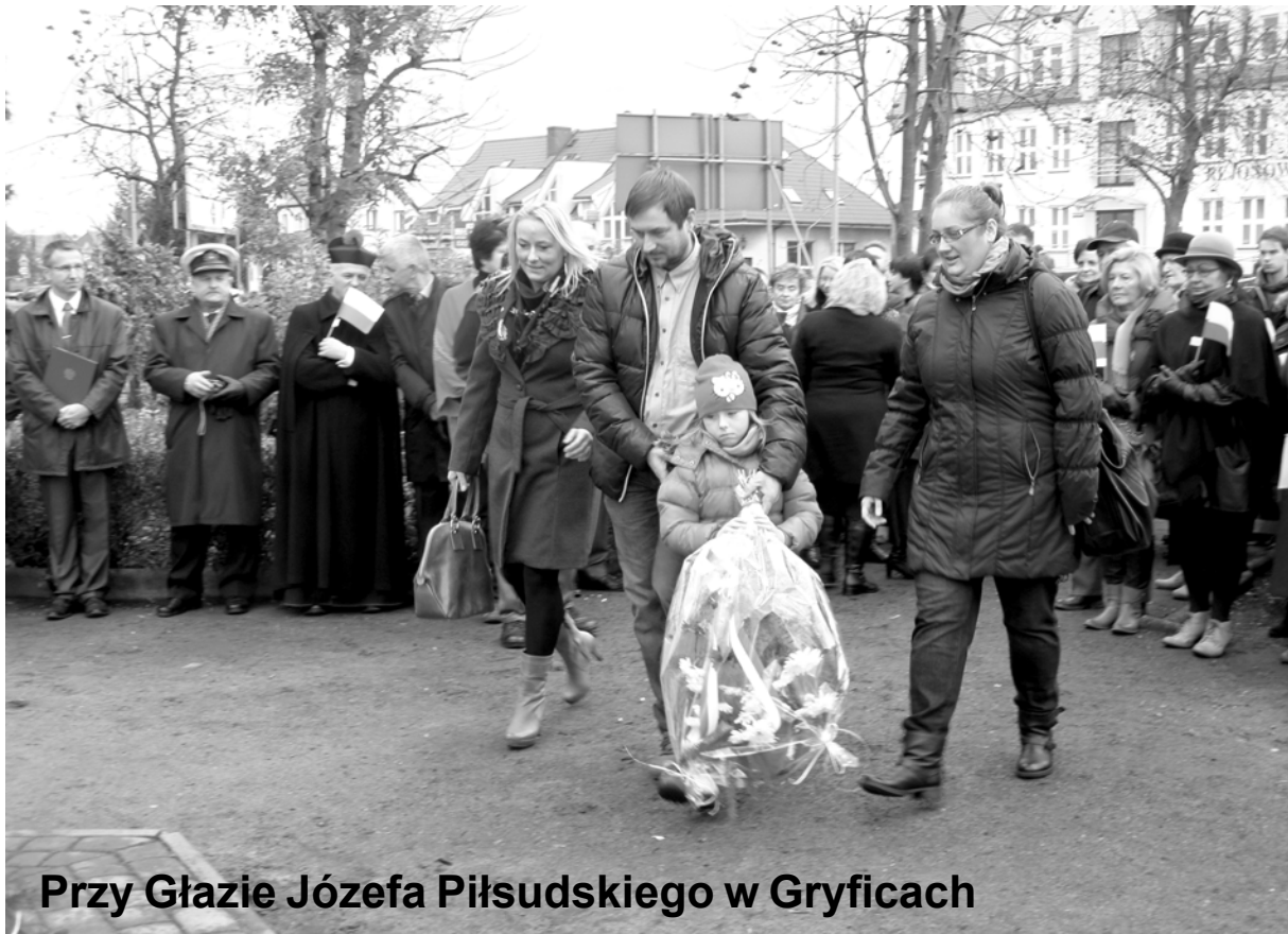
Przy Głazie Józefa Piłsudskiego w Gryficach