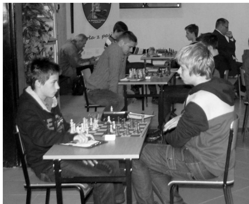
Smal -- ostatnia runda - partia decydująca o III miejscu