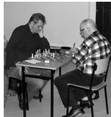
Nowy - ostatnia runda - partia decydująca o wygraniu kategorii 60+

Więcej informacji na www.uksszachgryfice.ubf.pl