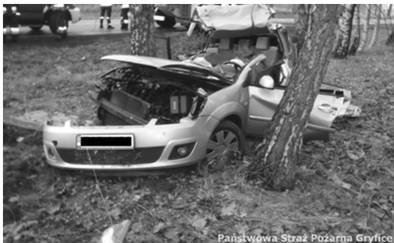
Państwowa Straż Pożarna Gryfice

Do wypadku doszło około godz. 13.40 – informuje powiatowa komenda Państwowej Straży Pożarnej w Gryficach. Na prostym odcinku drogi, w okolicy zjazdu do Badkowa, przed Płotami, samochód osobowy Ford Fiesta zjechał z szosy i uderzył w drzewo. W wyniku wypadku śmierć poniósł 53-letni kierowca i jego 49-letnia pasażerka. (r)