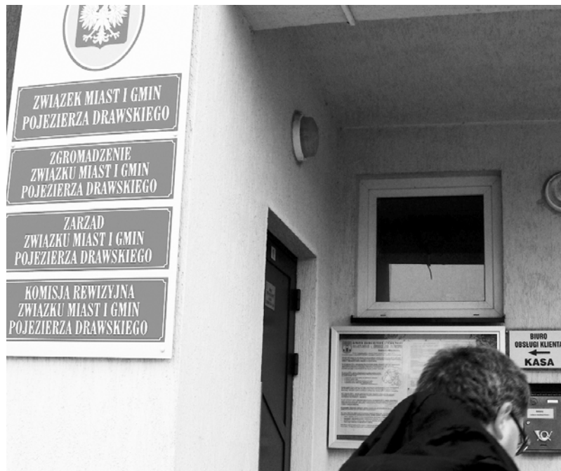
Siedziba Związku Miast i Gmin Pojezierza Drawskiego w Złociencu

Łączna kwota, jaką przeznaczono na wynagrodzenia Zarządu wyniosła 82.070 zł, czyli niewiele mniej,