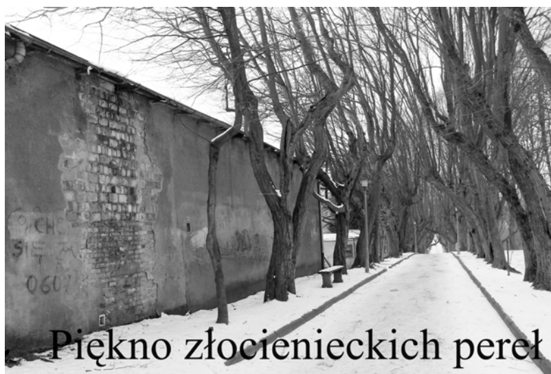
Piękno złocienieckich pereł