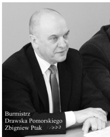
Burmistrz Drawska Pomorskiego Zbigniew Ptak