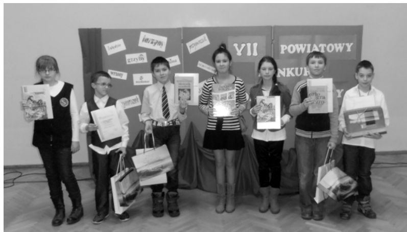
Reymonta w Złocieniu

III m. Jędrzej Lezler Szkoła Podstawowa nr 2 im. Władysława St.