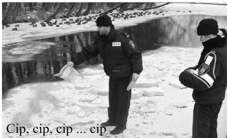
Cip, cip, cip ... cip

Wedle tylko intuicyjnych obliczeń, po połączeniu ZOK-u z OSi-Rem byłoby oszczędności do pół miliona. Nawet po pozostawieniu w straży miejskiej dwójeczki pań, przybyłoby chyba z niespełna trzysta tysięcy. Gdyby był w radzie miejskiej ktoś odważny, kto wycofałby ze Związku Miast i Gmin Pojezierza Drawskiego gminny wkład złotówkowy, który, jak się okazuje, posłużył etatom i pensjom, wówczas byłoby w kasie gminy kolejne kwoty. Mogłyby posłużyć wyciągnięciu jej z katastroficznego marazmu, w jakim się znalazła. Nie ma