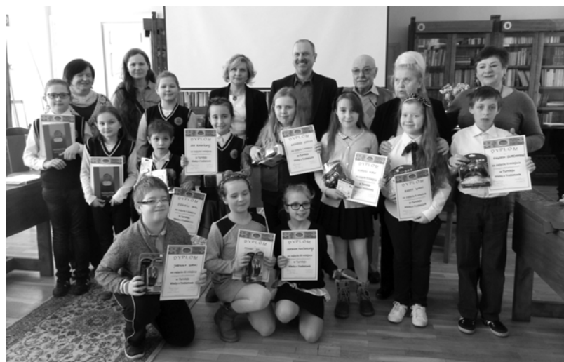
Uczestnicy kat. I-III