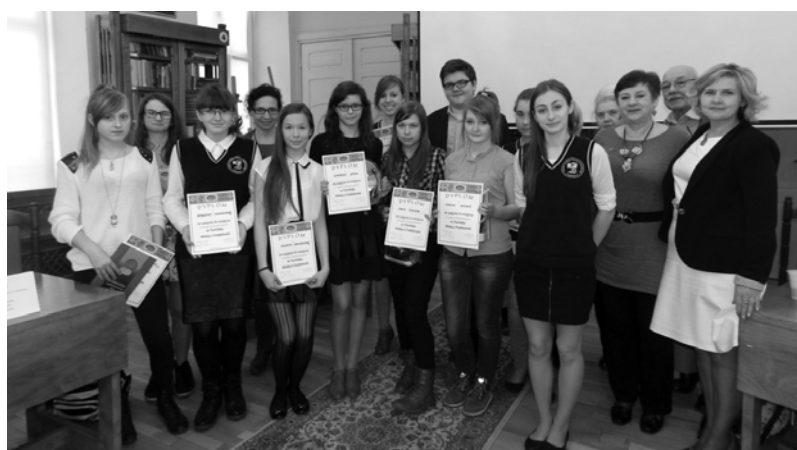
Uczestnicy kat. gimnazjum