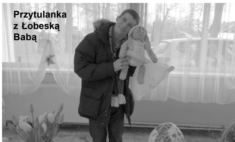
Przytulanka z Łobeską Babą

Zdjęcie do Galerii tygodnika można wykonać w Foto-Video „Krzyś” w Łobzie, www.fotopyrczak.pl