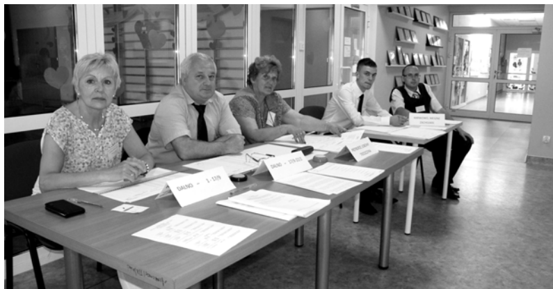
Komisja wyborcza nr 8 w przedszkolu w Łobzie niewiele miała do roboty - wydała zaledwie 49 kart wyborczych na 699 uprawnionych do głosowania.

(KRAJ-POWIAT) W powiecie łobeskim na 30.046 uprawnionych do głosowania oddano 3.793 głosów ważnych. Frekwencja w powiecie łobeskim wyniosła 13,40 proc. Najmniejsza frekwencja była w gminie Dobra, tutaj zagłosowało 8,92 proc. uprawnionych do głosowania; na 3.543 uprawnionych osób do głosowania oddano 295 głosów ważnych. Str. 8