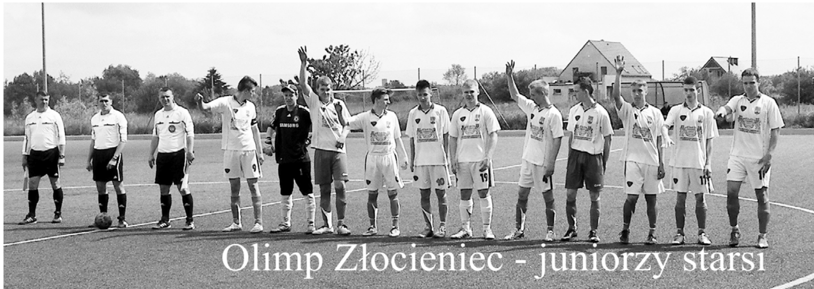
Olimpia Złocieniec - juniorzy starsi

(ZŁOCIENIEC). Starsi juniorzy Olimpii zakończyli rozgrywki. W pożegnalnym meczu u siebie pokonali Spójnię Świdwin 5:2. Graли w sobotę, trzydziestego pierwszego maja na gminniaku.