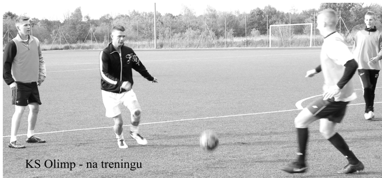
KS Olimp - na treningu

(ZŁOCIENIEC). Seniorzy KS Olimp Złocieniec mimo wspaniałej bazy do treningów toczą porywające boje, ale tylko o utrzymanie się w słabiutkiej klasie. Brakuje im kilku punktów do pewnego bytu w tych rozgrywkach.