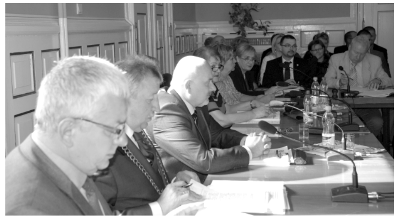
Zarząd Powiatu otrzymał absolutorium za wykonanie budżetu Powiatu w 2013 roku

d) wyrażenia zgody na przekazanie w formie darowizny na rzecz Województwa Zachodniopomorskiego nieruchomości stanowiących własność Powiatu Drawskiego;