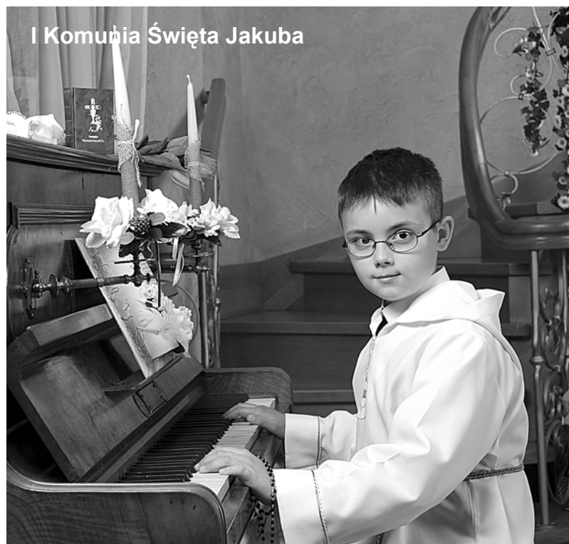
I Komunia Święta Jakuba