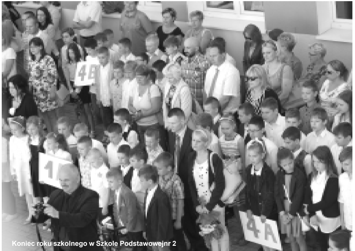
Koniec roku szkolnego w Szkole Podstawowej nr 2

W Szkole Podstawowej nr 1 Nagrodę otrzymała Magdalena Wojciechowska z kl. V, która jako jedyna osiągnęła rewelacyjną średnią wy-