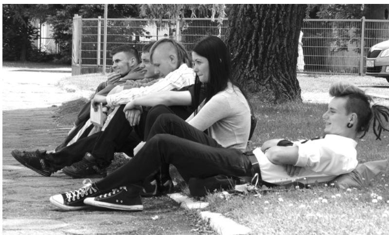
Wreszcie wakacje - zakończenie roku szkolnego w ZS w Łobzie