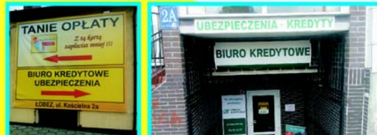
Lokalizacja biura w Łobzie przy ul. Kościelnej 2a.