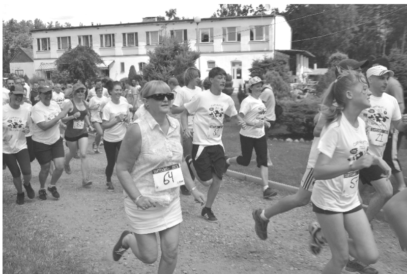
Tak biegano w roku ubiegłym

Możesz pomóc już teraz, wpłacając dar na konto: Chrześcijańska Służba Charytatywna, ul. Foksal 8, 00-366 Warszawa; 54 1240 1994 1111 0010 3162 7042 z dopiskiem: „Agatka Rutkowska”. (jl)