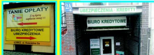
Lokalizacja biura w Łobzie przy ul. Kościelnej 2a.