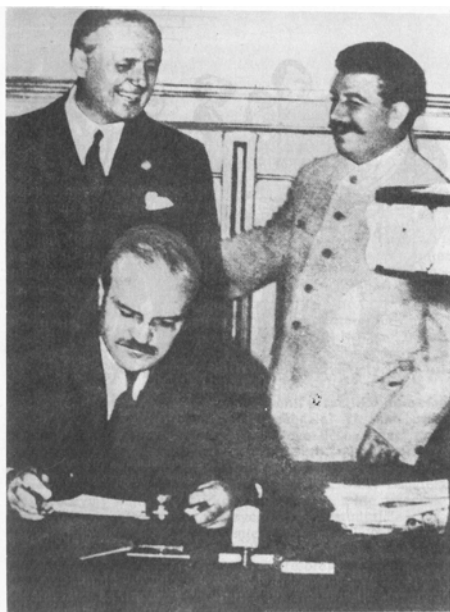
CZULEM SIĘ NA KREMLU JAK WŚRÓD STARYCH TOWARZYSZY PARTYJNYCH (J. von Ribbentrop w rozmowie z włoskim ministrem spraw zagranicznych Ciano 10 marca 1940 r.)

„Charakterystyczna jest wrzawa, jaką wszczęła prasa anglo-francuska i północnoamerykańska w sprawie Ukrainy Radzieckiej. Działacze tej prasy aż do schrypięcia krzyczeli, że Niemcy idą na Ukrainę Radziecką, że mają teraz w rękach tak zwaną Ukrainę Karpacką, liczącą blisko 700 tysięcy mieszkańców, że Niemcy nie później niż wiosną tego roku przyłączą Ukrainę Radziecką, mającą ponad 30 milionów ludności, do tak zwanej Ukrainy Karpackiej. Wygląda na to, że ta podejrzana wrzawa miała na celu wzniecenie gniewu Związku Radzieckiego przeciwko Niemcom, zatrucie atmosfery i sprokowanie konfliktu z Niemcami bez widocznych do tego podstaw.”