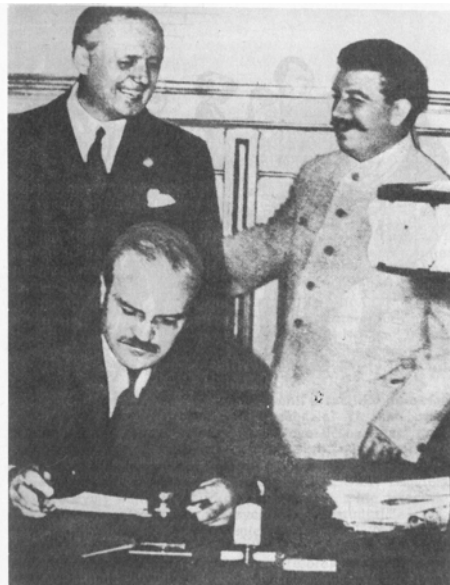
Czułem się na Kremlu jak wśród starych towarzyszy partyjnych. (Joachim von Ribbentrop w rozmowie z włoskim ministrem spraw zagranicznych Ciano, 10 marca 1940 r.)

„Charakterystyczna jest wrzawa, jaką wszczęła prasa anglo-francuska i północnoamerykańska w sprawie Ukrainy Radzieckiej. Działacze tej prasy aż do schrypięcia krzyczeli, że Niemcy idą na Ukrainę Radziecką, że mają teraz w rękach tak zwaną Ukrainę Karpacką, liczącą blisko 700 tysięcy mieszkańców, że Niemcy nie później niż wiosną tego roku przyłączą Ukrainę Radziecką, mającą ponad 30 milionów ludności, do tak zwanej Ukrainy Karpackiej. Wygląda na to, że ta podejrzana wrzawa miała na celu wzniecenie gniewu Związku Radzieckiego przeciwko Niemcom, zatrucie atmosfery i sprokowanie konfliktu z Niemcami bez widocznych do tego podstaw.”