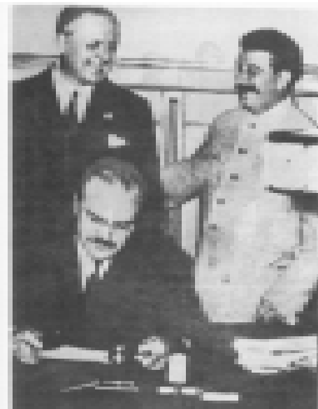
Czułem się na Kremlu jak wśród starych towarzyszy partyjnych.

„Charakterystyczna jest wrzawa, jaką wszczęła prasa anglo-francuska i północnoamerykańska w sprawie Ukrainy Radzieckiej. Działacze tej prasy aż do schrypięcia krzyczeli, że Niemcy idą na Ukrainę Radziecką, że mają teraz w rękach tak zwaną Ukrainę Karpacką, liczącą blisko 700 tysięcy mieszkańców, że Niemcy nie później niż wiosną tego roku przyłączą Ukrainę Radziecką, mającą ponad 30 milionów ludności, do tak zwanej Ukrainy Karpackiej. Wygląda na to, że ta podejrzana wrzawa miała na celu wzniecenie gniewu Związku Radzieckiego przeciwko Niemcom, zatrucie atmosfery i sprokowanie konfliktu z Niemcami bez widocznych do tego podstaw.”