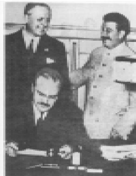
Czułem się na Kremlu jak wśród starych towarzyszy partyjnych. (Joachim von Ribbentrop w rozmowie z włoskim ministrem spraw zagranicznych Ciano, 10 marca 1940 r.)

„Charakterystyczna jest wrzawa, jaką wszczęła prasa anglo-francuska i północnoamerykańska w sprawie Ukrainy Radzieckiej. Działacze tej prasy aż do schrypięcia krzyczeli, że Niemcy idą na Ukrainę Radziecką, że mają teraz w rękach tak zwaną Ukrainę Karpacką, liczącą blisko 700 tysięcy mieszkańców, że Niemcy nie później niż wiosną tego roku przyłączą Ukrainę Radziecką, mającą ponad 30 milionów ludności, do tak zwanej Ukrainy Karpackiej. Wygląda na to, że ta podejrzana wrzawa miała na celu wzniecenie gniewu Związku Radzieckiego przeciwko Niemcom, zatrucie atmosfery i sprokowanie konfliktu z Niemcami bez widocznych do tego podstaw.”