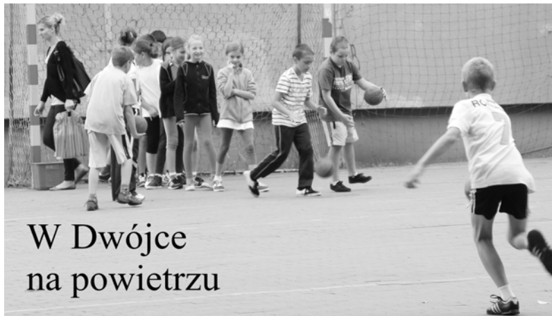
W Dwójce na powietrzu