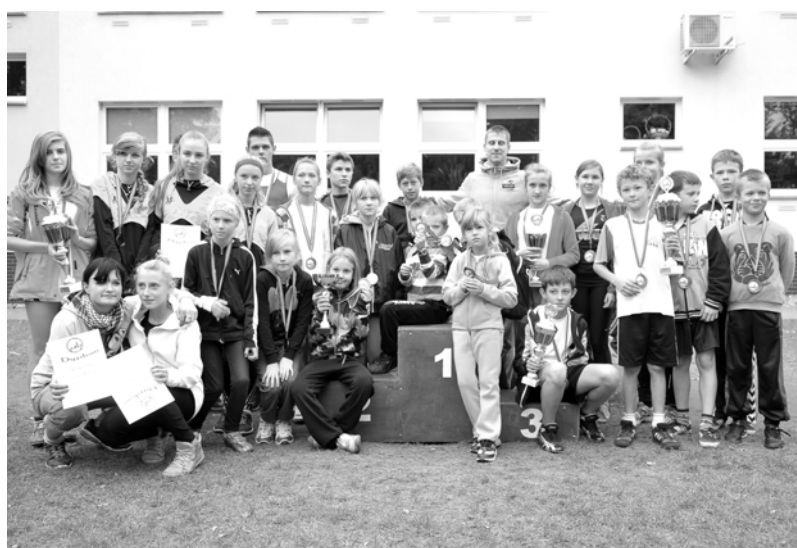
Najlepsi w Węgorzynie w 2013 roku