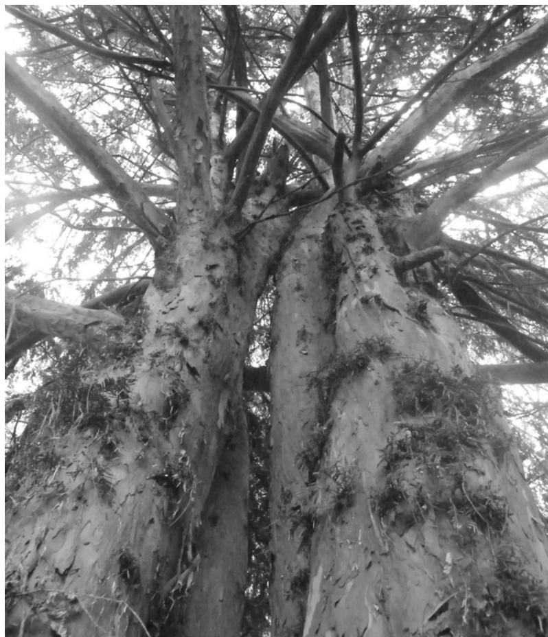
U góry: czteropienny cis, na dole: pałac.