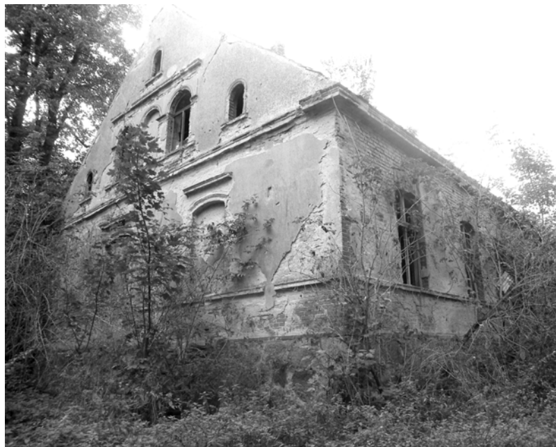
Pałac i ruiny zabudowań przypałacowych