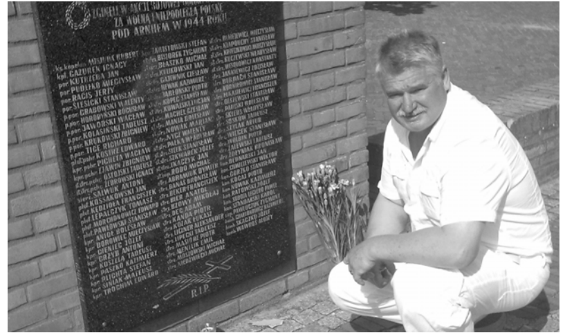
Tablica upamiętniająca imiennie prawie stu żołnierzy polskich, z napisem: „Zginęli w akcji bojowej - oddając swe życie za wolną i niepodległą Polskę pod Arnhem w 1944 roku”.

Polskie groby w Driel zostały przeniesione za rzekę, na cmentarz Grobów Wojennych Wspólnoty Brytyjskiej w Oosterbeek. Wywoła-